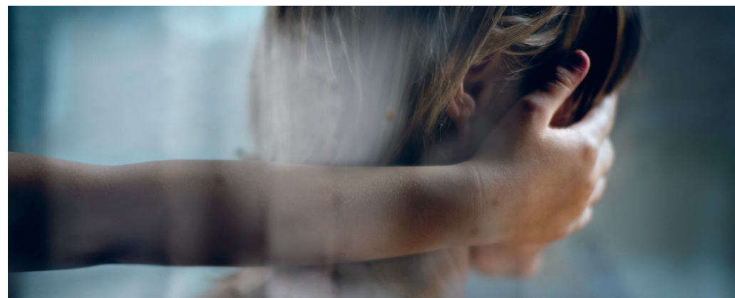
INNE GORIS

Galop DOLORES BOUCKAERT PERFORMANCE/THEATRE (20-22/03)