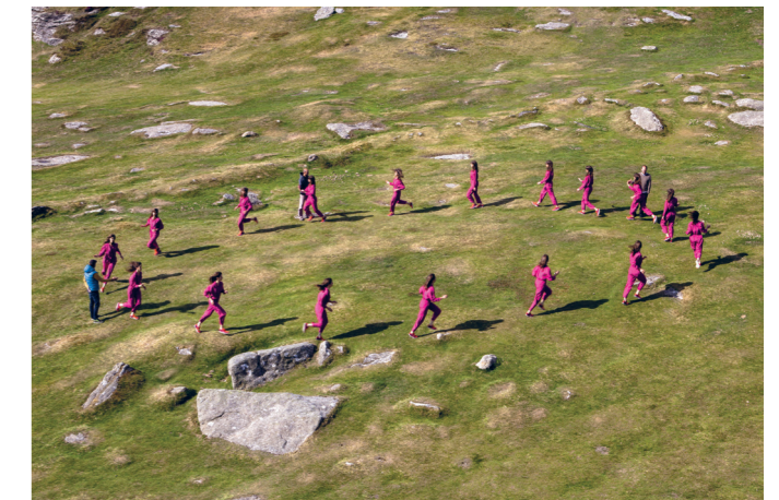
VERA TUSSING

A Breath Cycle FABRICE SAMYN PERFORMANCE (21-22/04)